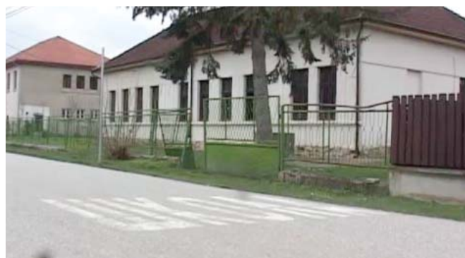
Ученици ИО Катрга:

ИО Катрга је имала учешће и у организацији манифестације „Курсулини дани“, која се ове године одржала у селу Катрга, такође сваке го-