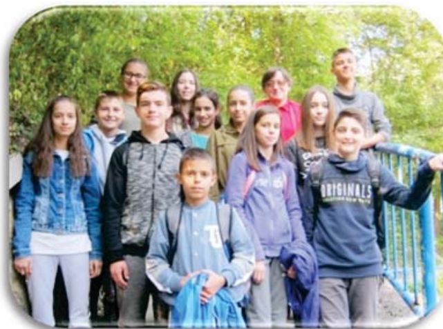
ЕВW17. - Овчарско-кабларска клисура

Под окриљем наставног садржаја биологије који ученици савлађују одржан је велики број јавних часова. Јавни час који је одржан у оквиру Дечје недеље, 09.10.2013. имао је за циљ развијање свести о значају озонског омотача за живи свет и опасности од озонских рупа. Час је реализован кроз корелацију биологије и српског језика, рецитовањем песама, слањем еколошких порука и извођењем драмског комада „Озонски омотач“.