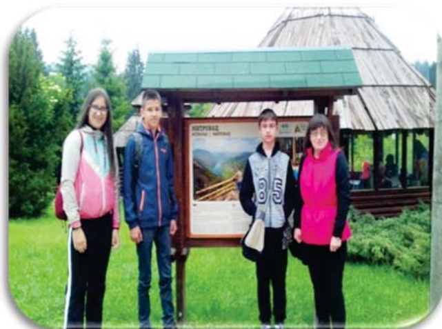
Тара- Еко-фест ЧА17.