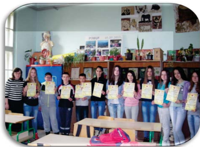
Вредни и успешни млади биолози