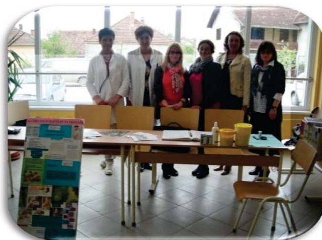
Светски дан здравља