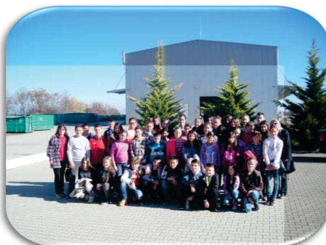
„Дубоко“ - Ужице