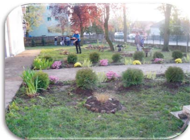
Учесници у реализацији пројеката

Традиционално учествујемо на манифестацији „Еко-фест“ која се сваке године организује поводом обележавања Светског дана заштите животне средине, 5. јуна. Последње две године, учешће школа је такмичарског карактера. Можемо да се похвалимо да су креативни ученици наше школе у конкуренцији основних школа 2016. године на ликовном конкурсима „Рециклирај- креирај“ освојили треће место, а 2017. године на конкурсима „Упознај, истражи и кажи“ друго место за кратак еколошки филм „Обалама западне Мораве“, из тог разлога екипа наше школе је ушла на стручни наградни излет на Тару.