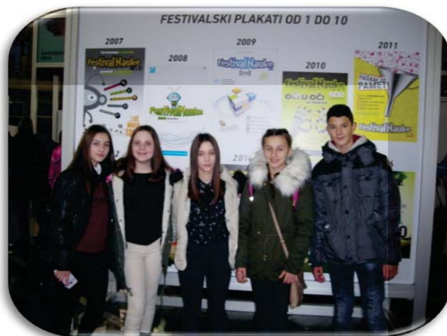
Фестивал науке - 2016.